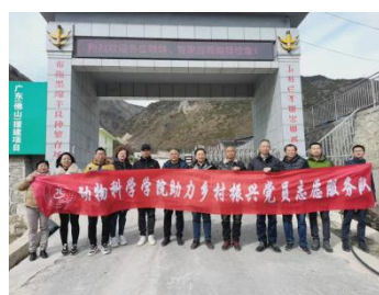
师生赴美姑县沙溪洛村开展冷水鱼养殖技术培训