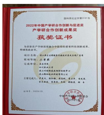
荣获产学研合作创新成果奖二等奖