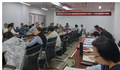
学习习近平总书记来川视察重要讲话精神