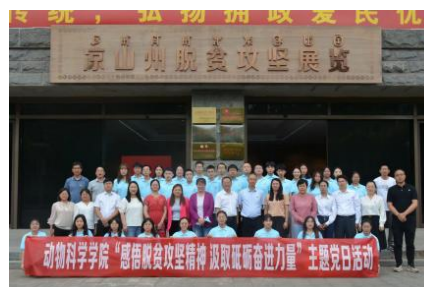
赴凉山州脱贫攻坚展览馆开展活动