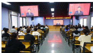
集中收看党的二十大开幕会直播

学院党委始终坚持以习近平新时代中国特色社会主义思想为指引，紧扣立德树人根本任务，围绕区域经济社会发展，秉承“育人本位、社会本位、学生本位”办学理念，凝心聚力推动学院内涵式高质量发展。