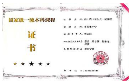
国家一流本科课程证书