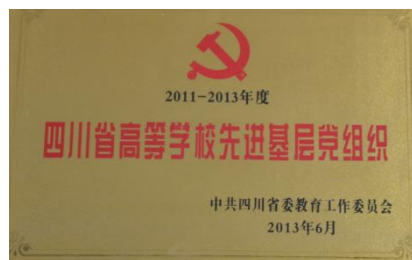
四川省高等学校先进基层党组织