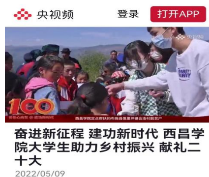
建团100周年前夕，动科学子赴布拖俄里坪镇开展帮扶活动得到央视报道