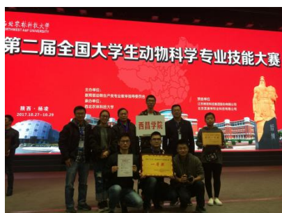
参加全国大学生专业技能大赛荣获一等奖