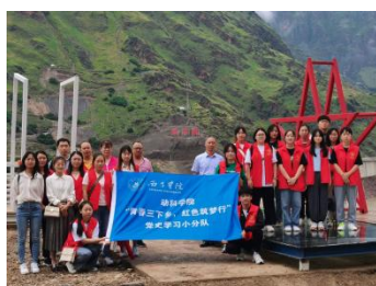
师生到红军长征巧渡金沙江渡口—会理皎平渡开展红色教育