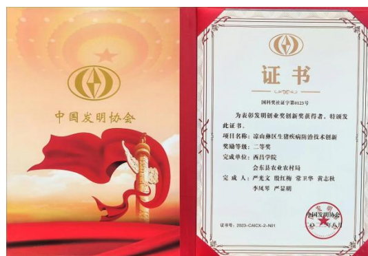
荣获中国发明协会颁发的发明创业奖创新奖二等奖