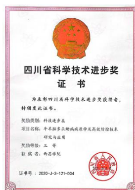
荣获四川省政府科技进步三等奖