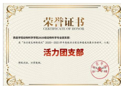
2020级动物科学1班荣获2021年度“全国活力团支部”