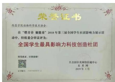
动物科学技术协会获得2019年度“全国学生最具影响力科技创造社团”