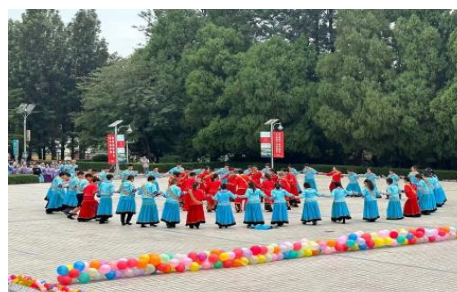
一年一度的彝族舞蹈达体舞比赛